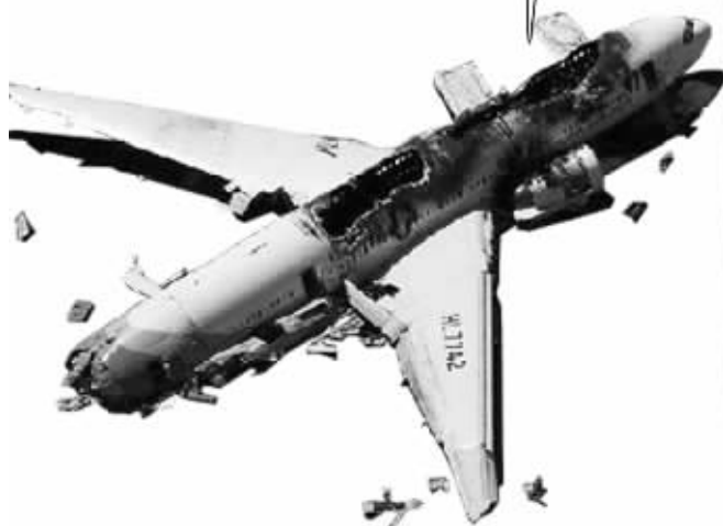
飞机偏离跑道起火燃烧

失事航班上的中国旅客,有很多是先在浦东机场乘坐OZ368航班(空客A330型客机)飞赴首尔,中转等候了1个多小时后,再换机转乘OZ214航班(波音777型客机)飞往旧金山。