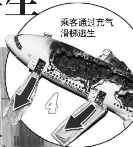
乘客通过充气滑梯逃生