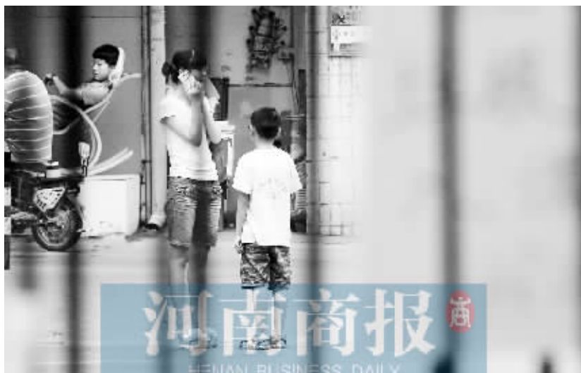
不少家长表示,来学校交完学费,总算能松口气了